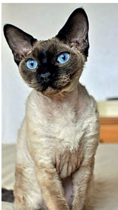
Rudy, vek 6 rokov

Postupne som začala intuitívne viac a viac vnímať, ako prítomnosť mačky odbúrava napätie, navodzuje príjemné pocity a pomáha človeku stať sa citlivým a láskavým, ba dokonca zmierňuje fyzické